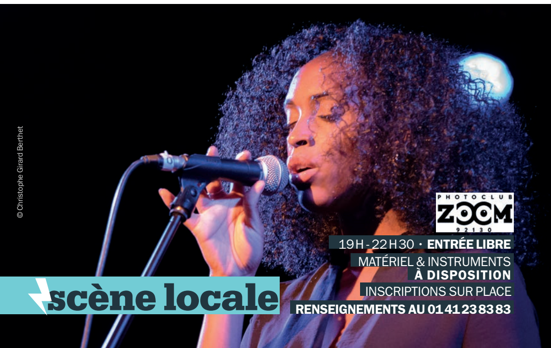
PHOTO CLUB ZOOM 92130